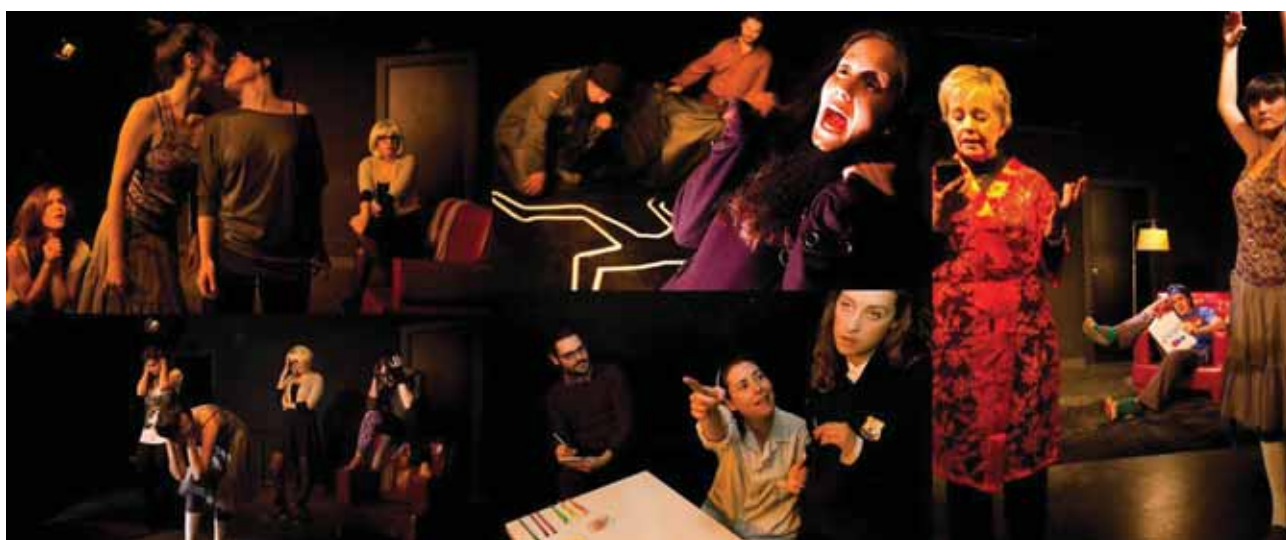
Fotomontaje de la obra El Pánico de Rafael Spregerlburd, programada en AZarte del 26/1 al 11/2 del 2012.

Para reservar tu plaza puedes mándarnos tu CV y fotos a info@azarte.com